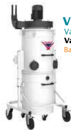
VCE 1570 Vakum Talaş Emici Vacuum Chip Extractor Вакуумный экстрактор стружки VCE 1570