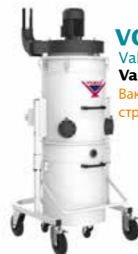
VCE 1570 Vakum Talaş Emici Vacuum Chip Extractor Вакуумный экстрактор стружки