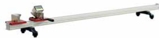
DLG 100 - DLG 200 - DLG 300 - DLG 550 Dijital boy ölçme cihazı DLG 100 - DLG 200 - DLG 300 - DLG 550 Digital length gauge Устройство для измерения длины профиля DLG 100 - DLG 200 - DLG 300 - DLG 550