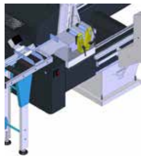
Kısa profil kesme sistemi Short cut system Упор для установки длины профиля