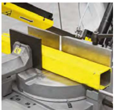
Synchron drehbarer Tisch des Hauptspannstockes