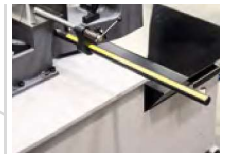
Möglicher Anschluss des Längenaufschlags