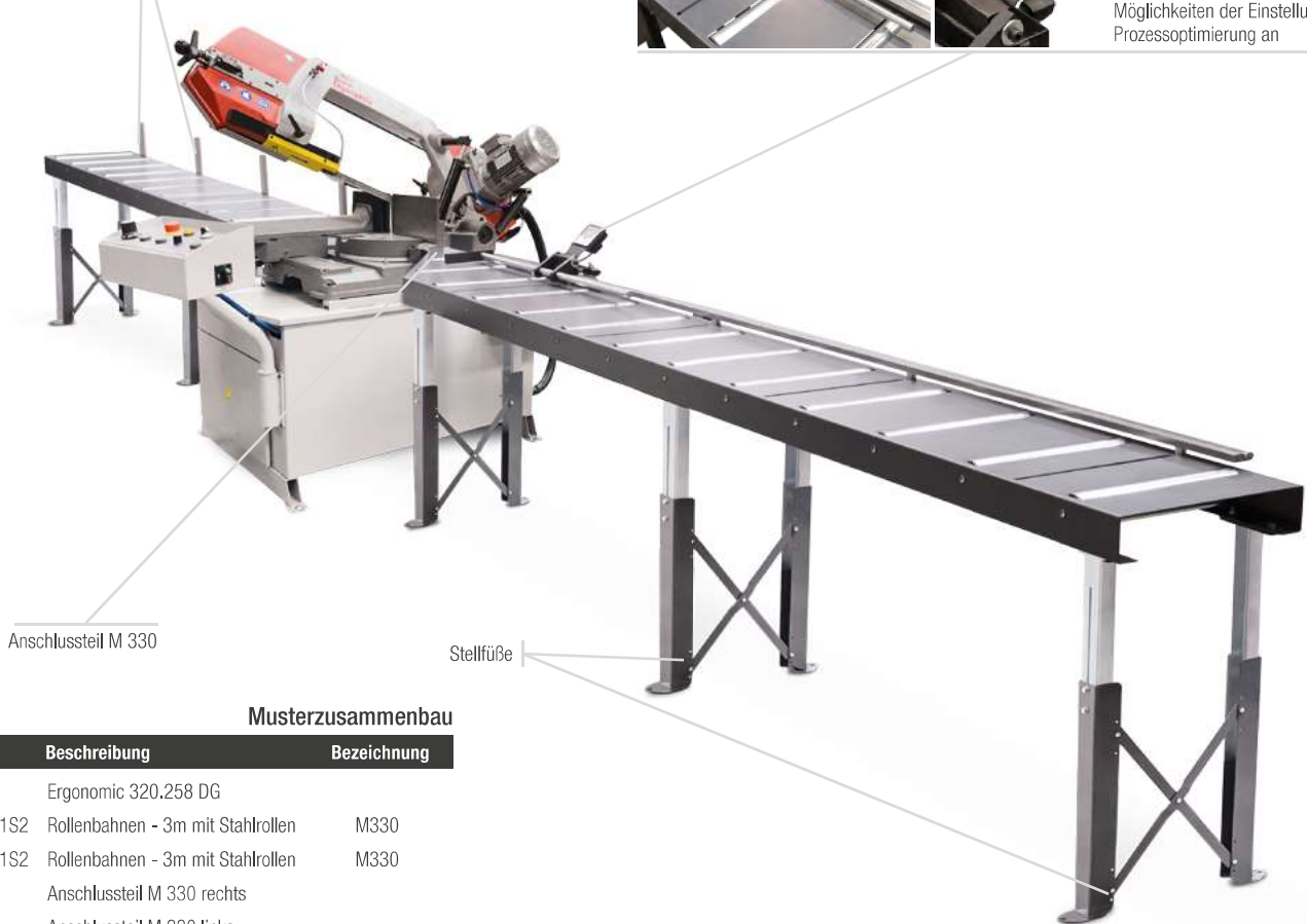
Anschlussteil M 330

Die Längenanzeige befindet sich direkt am Support des Anschlags und zeigt die genaue Position in Echtzeit an. Das Anzeigesystem bietet verschiedene Möglichkeiten der Einstellung und Prozessoptimierung an