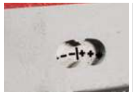
Indikator der Sägebandspannung

Anlage bietet die Möglichkeit, beidseitige Gehrungsschnitte zu machen. In der Grundausführung ist die Anlage mit einem Frequenzumrichter ausgerüstet, welcher stufenlose Regelung der Sägebandgeschwindigkeit von 20 m/min bis 120 m/min ermöglicht. Dadurch werden die Lebensdauer der Sägebänder und Produktivität der Anlage bedeutend erhöht.