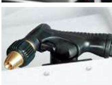
Pistole für das Abspülen der Späne

Für besonders breite Materialien wird eine dritte Kühlmittelzuführung eingesetzt. Die Kühlmittelleitung ist flexibel und kann individuell auf die Materialform angepasst werden