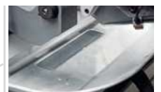
Einfach abnehmbare Spänewanne